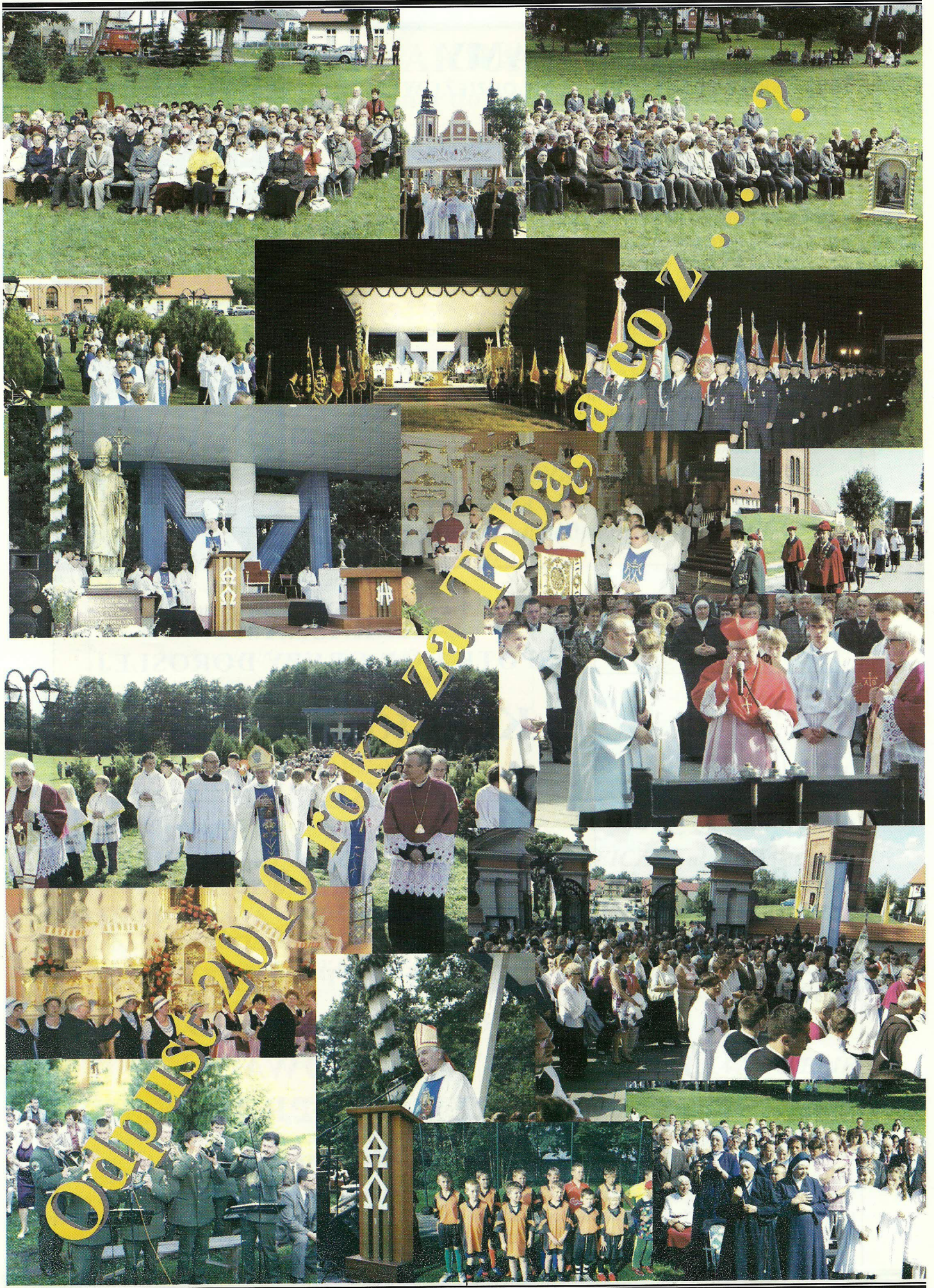
Z KRASNEGO WZGÓRZA